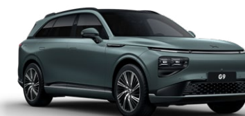
Kaitoke Green Matte זמין בגרסת Performance בלבד